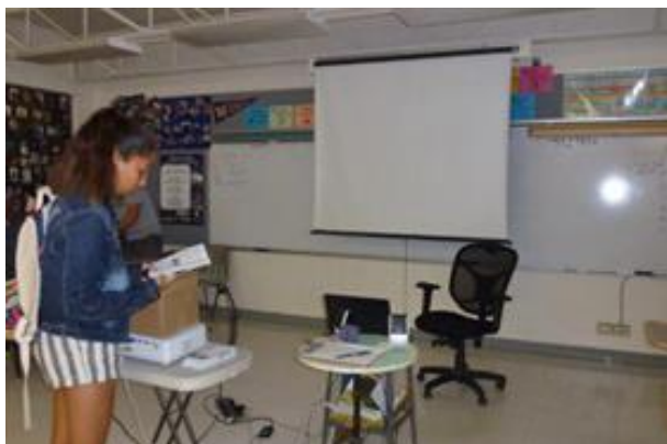
スクリーンを使った世界史の授業です