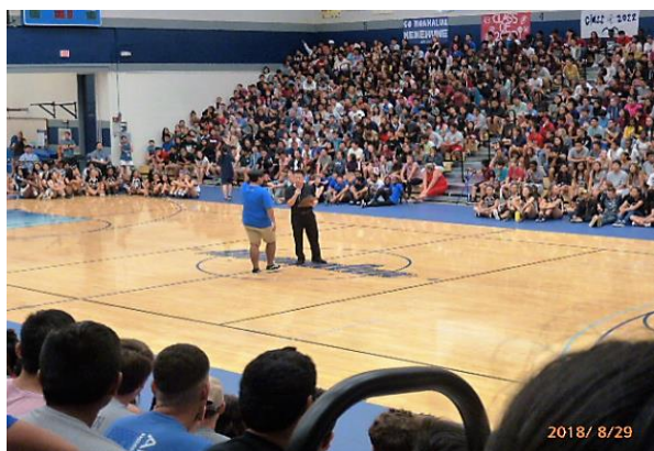
吹奏楽、チアガールの発表や、学年対抗クイズ