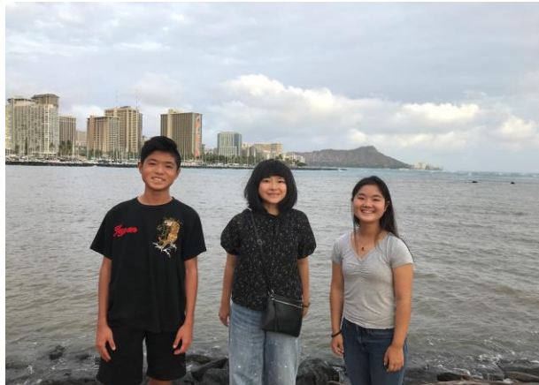
マカプウのハイキングコース 山の頂上まで昇りました