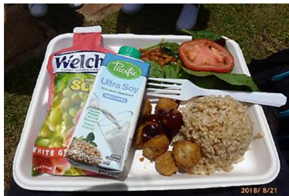
モアナルア高校の食堂のランチです