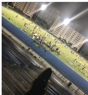
マーチングバンドの練習を見学しました