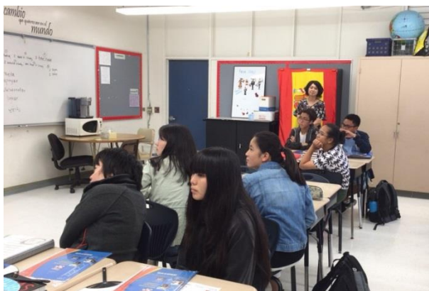
日本語の授業に参加しました