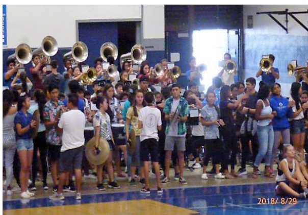
2,000 人の全校集会は大盛り上がり