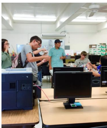
放課後の working 終了 店のレジをしたり、お金を数えたりします