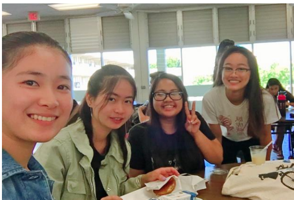
朝食を学校で食べています