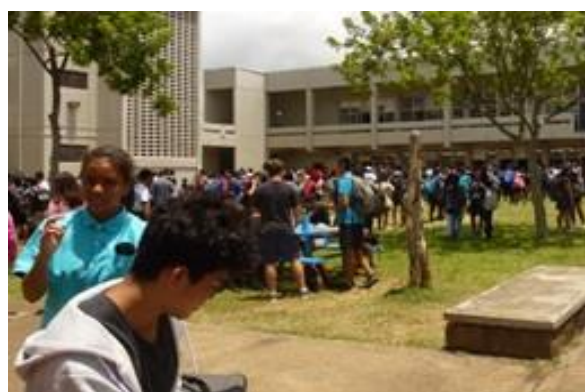
多くの生徒が外で昼食を食べます