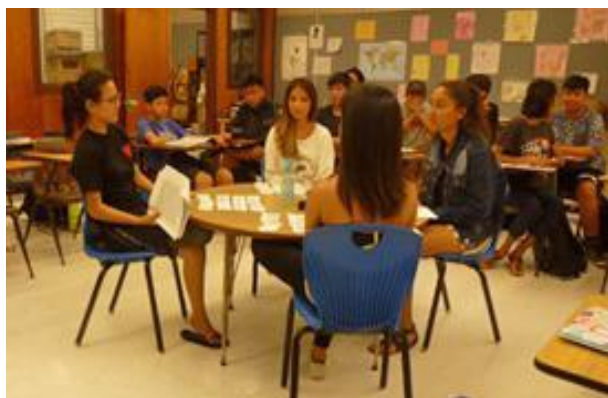
英語の授業 記事を読んでディスカッション