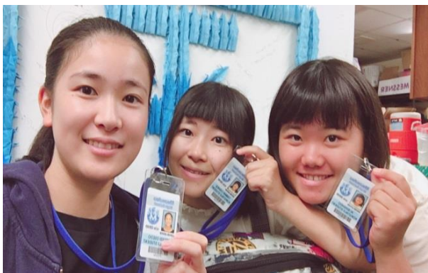
生徒証をもらいました