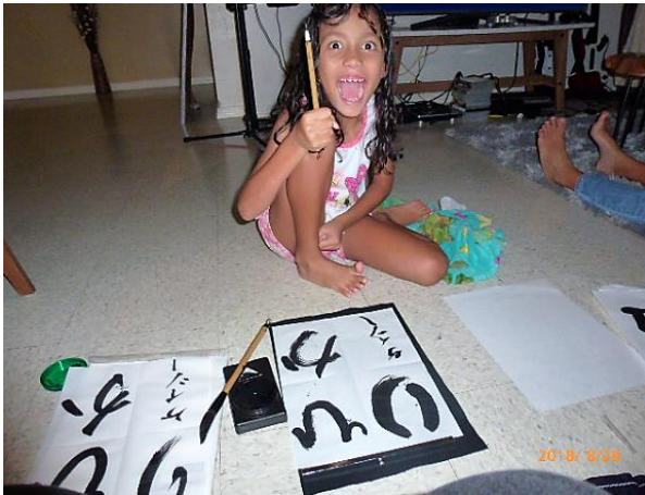
ホストシスターに書道を教えています