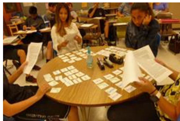
意見を述べたり、質問したりする主体的な学習です