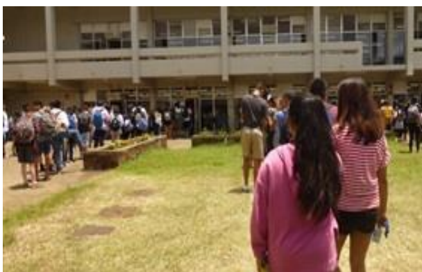
ランチタイム 食堂の前に長蛇の列ができます